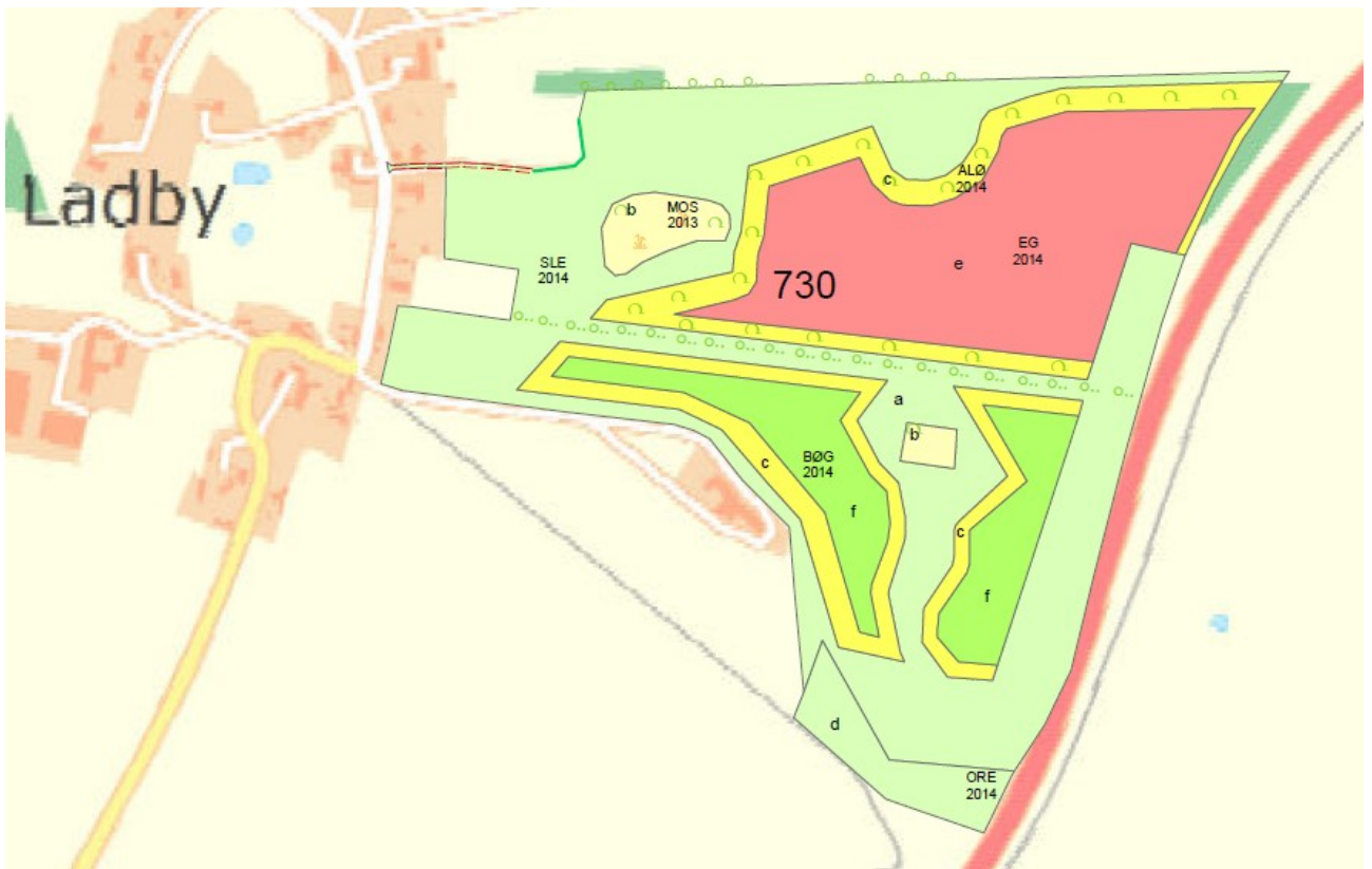
Skovrejsningsprojekt: Ladby Skov